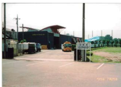
開所したばかりの旧センター。ペット棟やリプレがまだ出来ていない