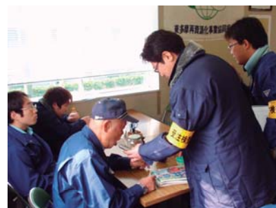
共同受注検査の様子