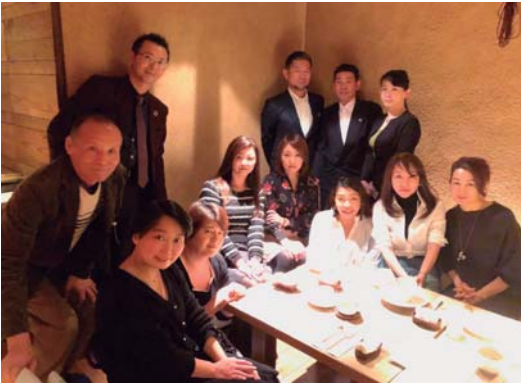
当日は、女子トークで大盛り上がりしました。

「子会」が開催されました。一昨年の年末に開催された第一回女子会は、業界紙でリサ女特集が組まれるなど、反響があり、二回目の開催となりました。 男性が多いこの業界の中で、普段は少数派のリサ女の方々が、前回より二名増えて九名参加して頂き、美味しい料理を食べながらざつとまでお話が出来て大変楽しかったです。業種は問屋さんも回収業者さんも色々ですが、普段されているお仕事が事務や営業、管理業務の方が多く、お話して頂くことができる部分が多いのもこの女子会のいいところです。 女子限定でお土産も用意して頂き、至れり尽くせり。次回以降は