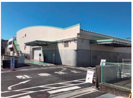
新センター 北側搬入出車両入口