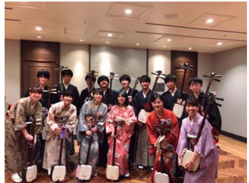
早稲田大学三味線愛好会 『三津巴』の皆様