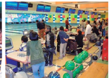
毎年恒例のボウリング大会