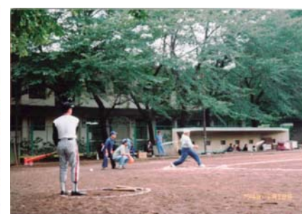
懐かしのソフトボール大会