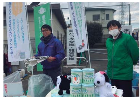
リサイクルきゃらばんの様子