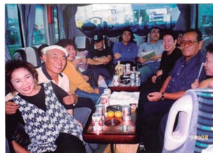
楽しかったバス旅行