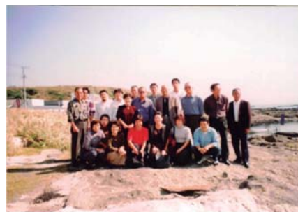
旅行での集合写真