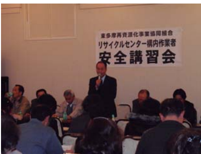
構内作業員安全講習会