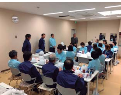
4月1日の朝礼での理事長挨拶