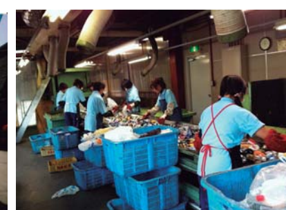
選別ラインの様子