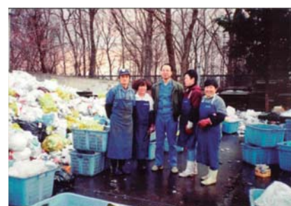
屋根もない中での選別作業