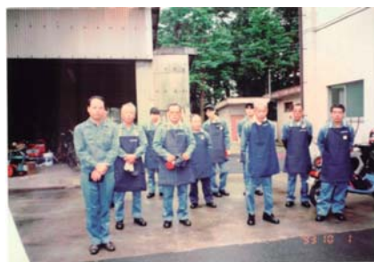
業務開始日の朝礼の様子