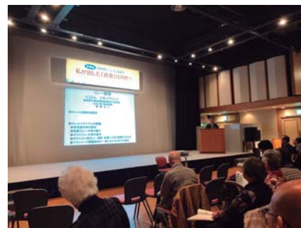
リレー講演の様子

ープデイスカッション、ダイナックス都市環境研究所山本所長の進行による全体デイスカッションで閉会となりました。(吉浦)