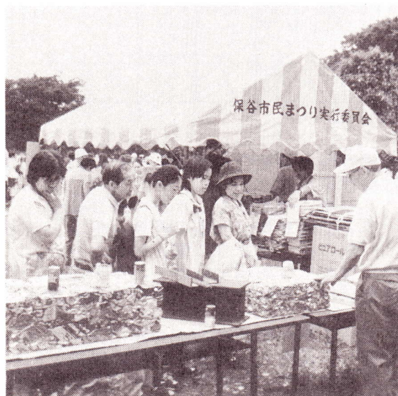
保谷市フリーマーケットで熱心にリサイクルの説明を聞く市民

もつとも、説明を聞いて下さった方々に配ったトイレットペーパーが二千五百個でしたから、その並々ならぬ奮闘ぶりも合わせてご推察下さい。 (佐々木)